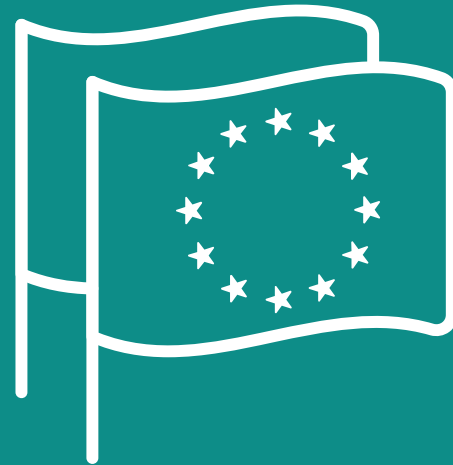
NATIONAL EU NODE